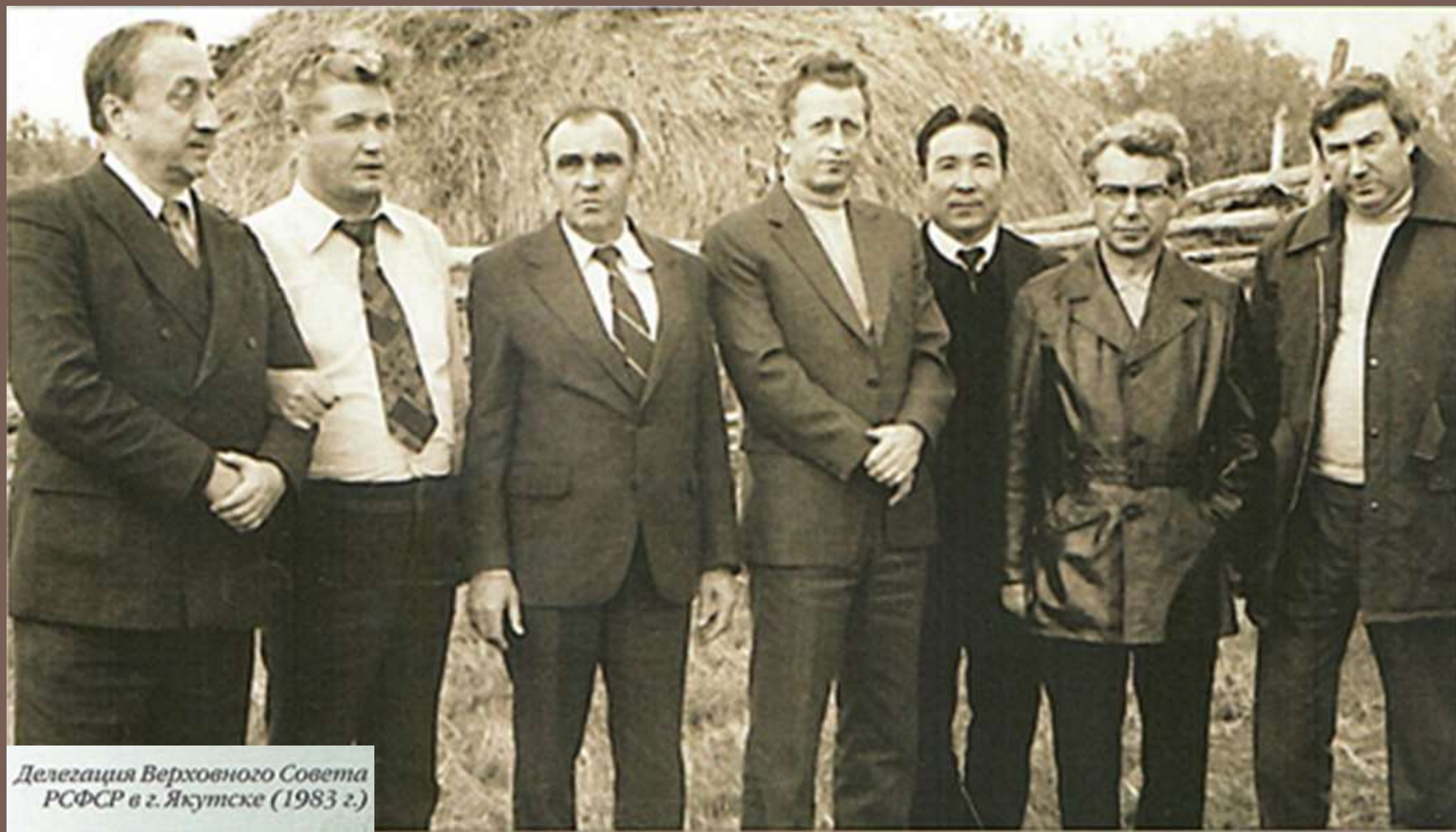
Делегация Верховного Совета РСФСР в г. Якутске (1983 г.)