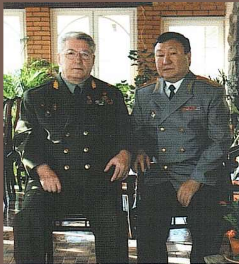
С заместителем министра Г.А. Корниловым (2005 г.)