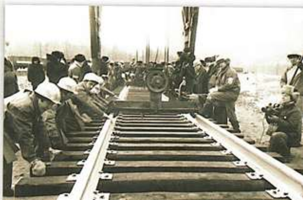
Укладка «золотого звена» от станции Беркамит в сторону Якутска (март 1984 г.)