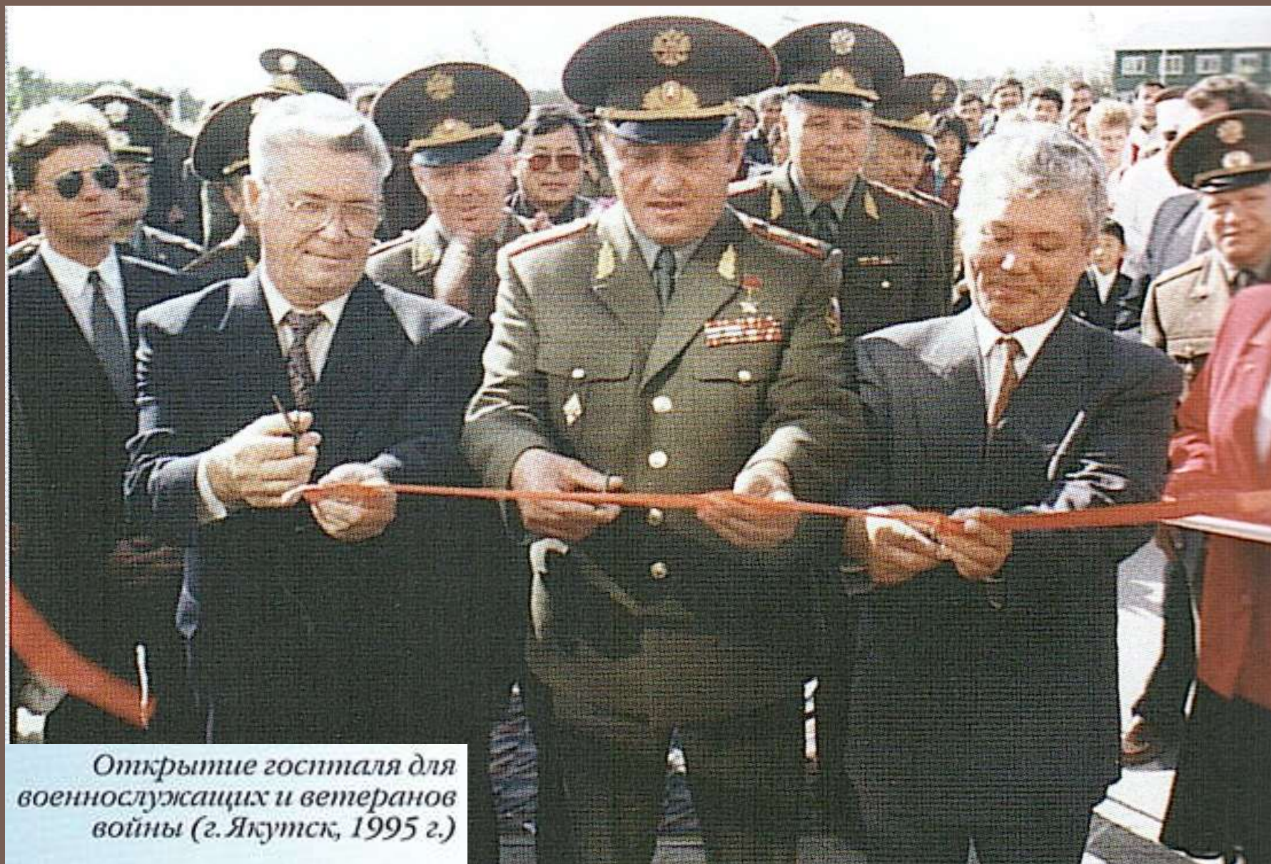
Открытие гостяля для военнослужащих и ветеранов войны (г. Якутск, 1995 г.)