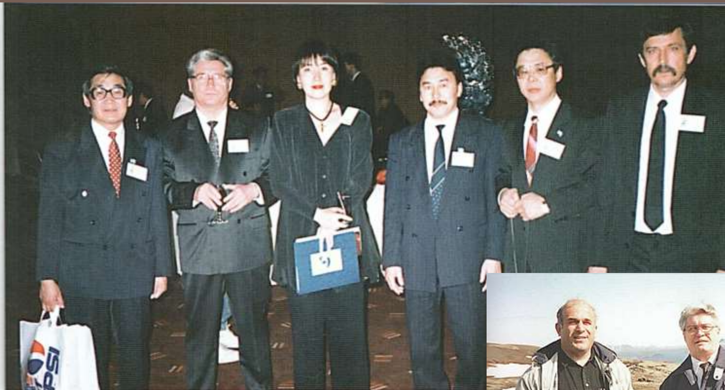
Члены якутской делегации