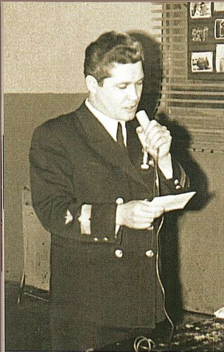
Отчет перед коллективом завода в блоке цехов Жатайского ССРЗ (1978 г.)