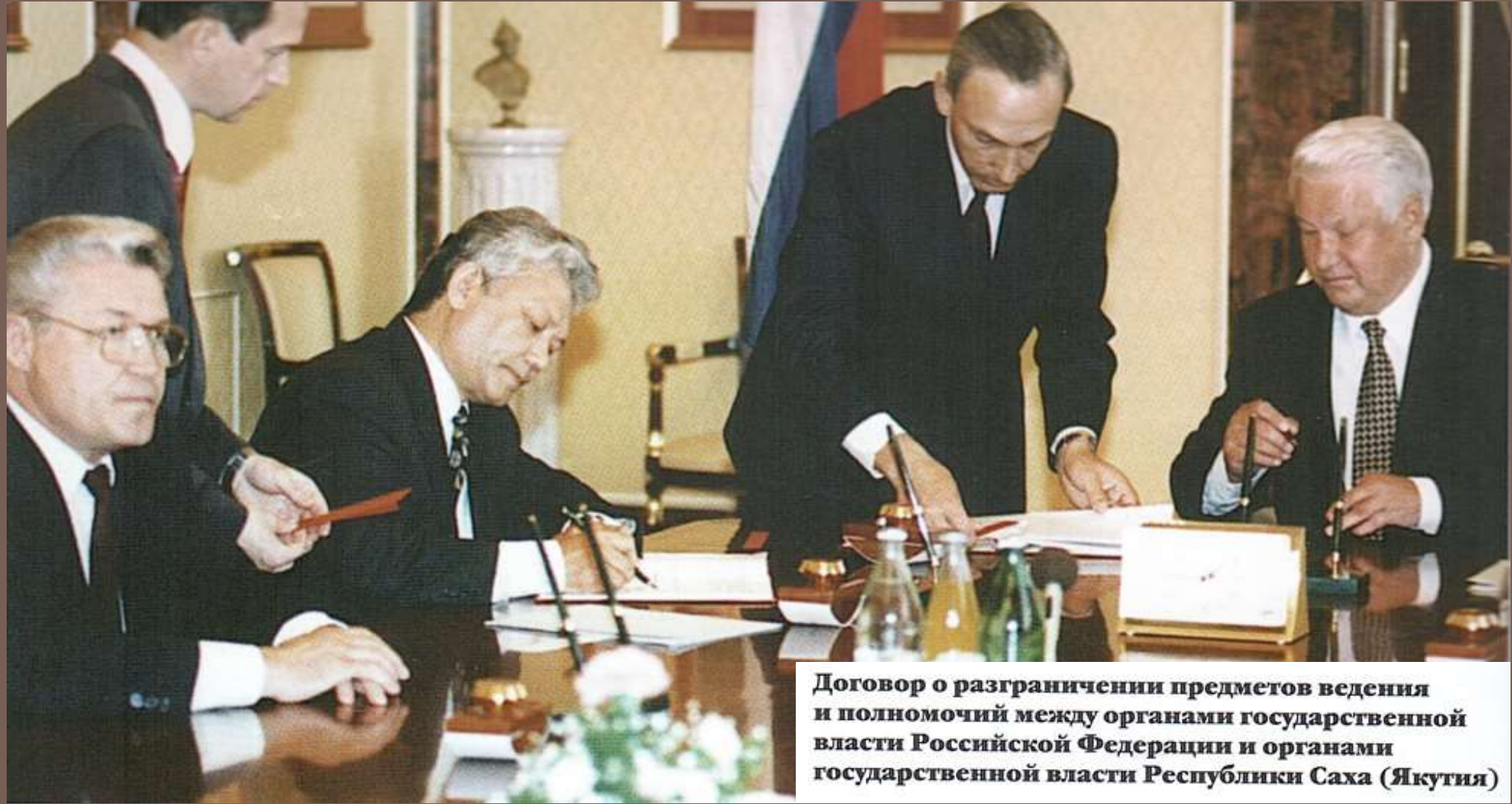
Договор о разграничении предметов ведения и полномочий между органами государственной власти Российской Федерации и органами государственной власти Республики Саха (Якутия)