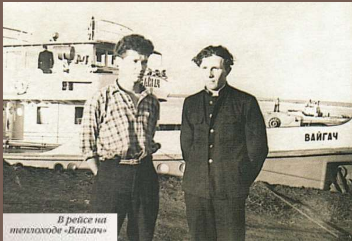
В рейсе на теплоходе «Вайгач»