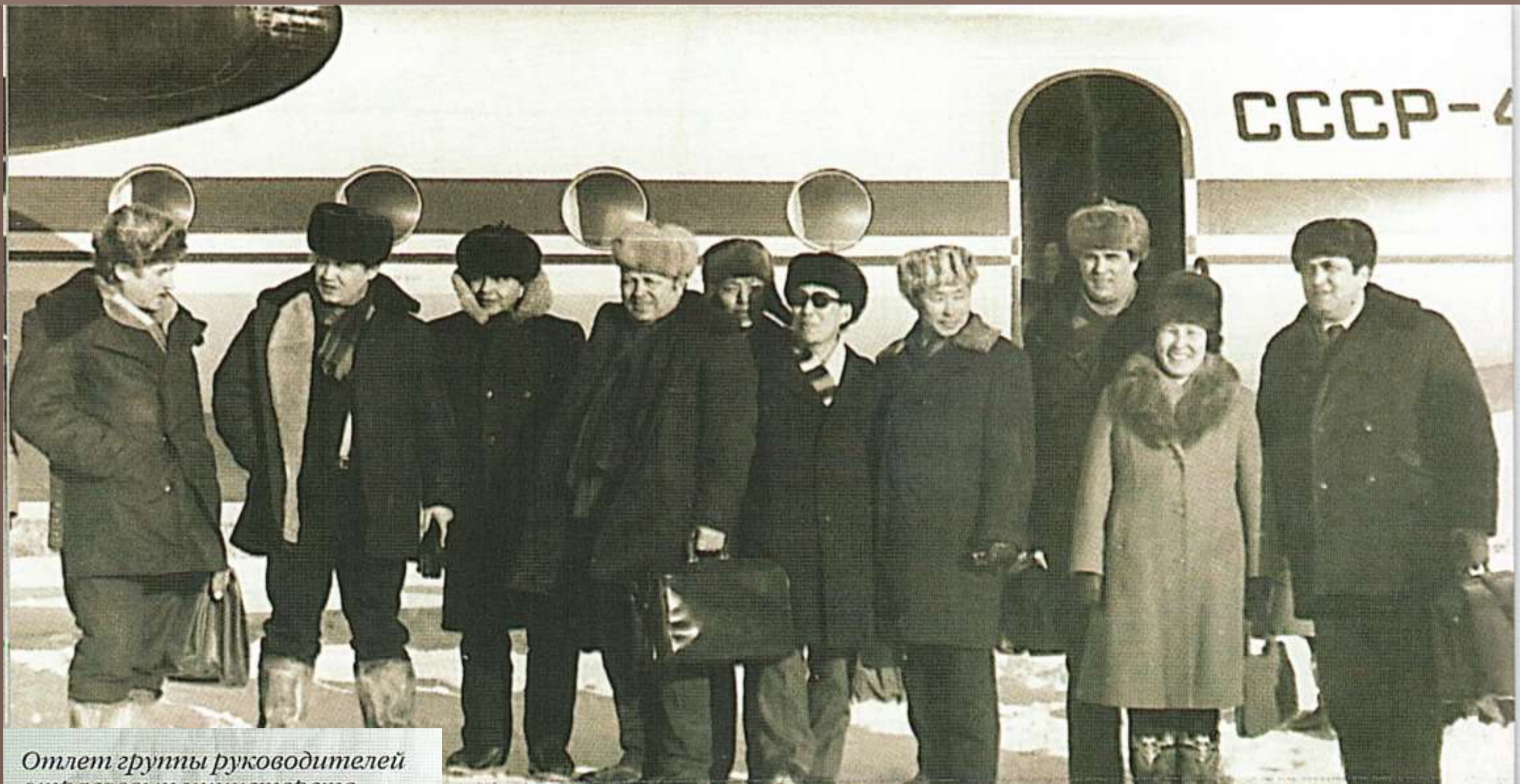
Отлет группы руководителей отраслевых министерств и ведомств в Оленекский район (1981 г.)