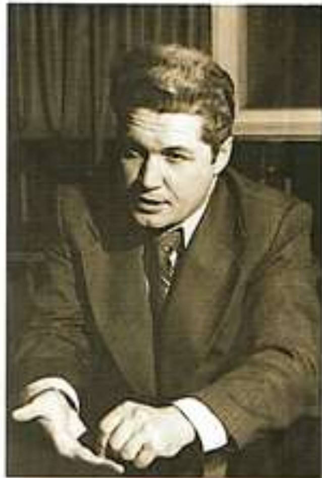
Директор завода (1974 г.)