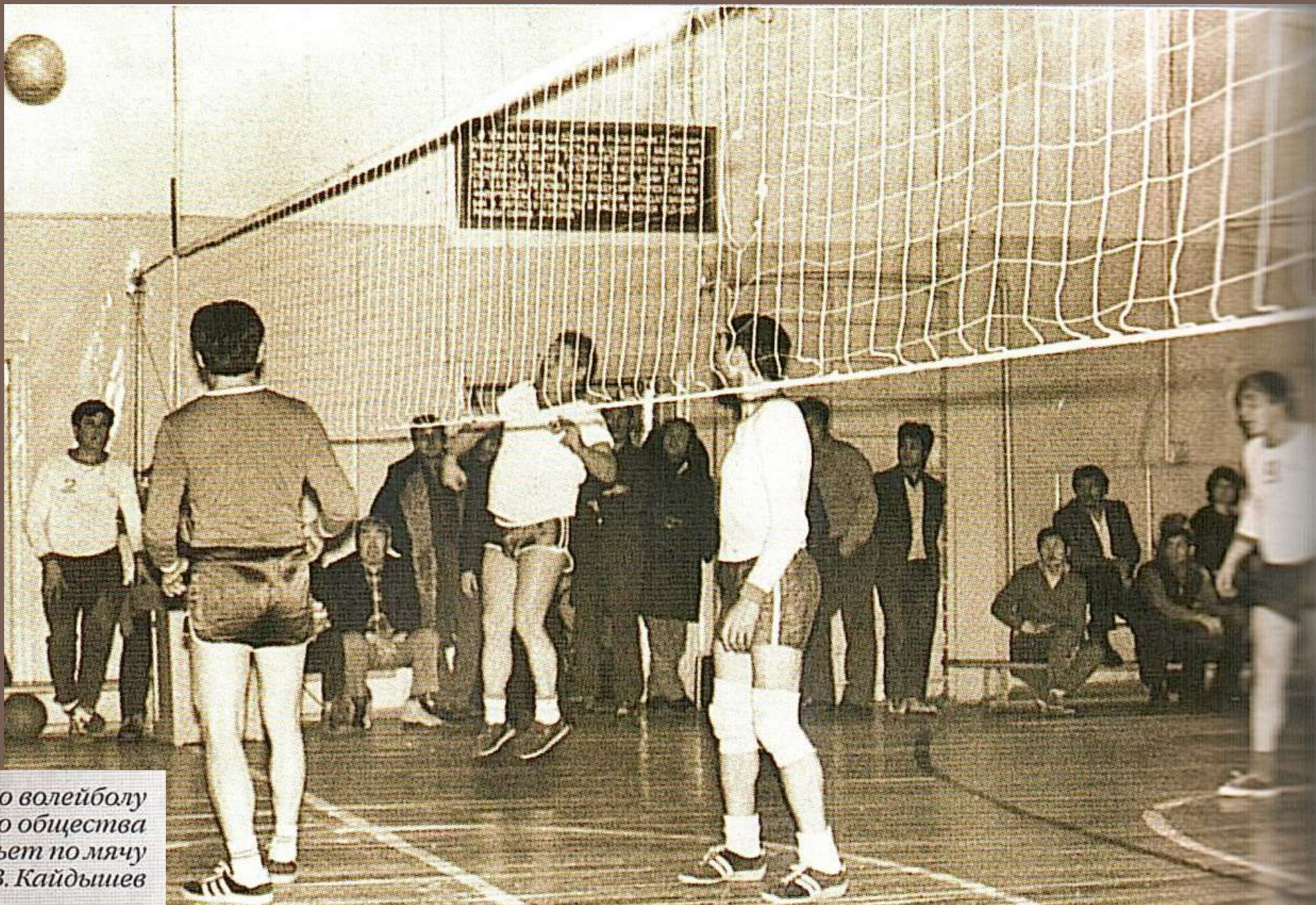
Соревнование по волейболу спортивного общества «Динамо». Бьет по мячу министр Ю.В. Кайдышев