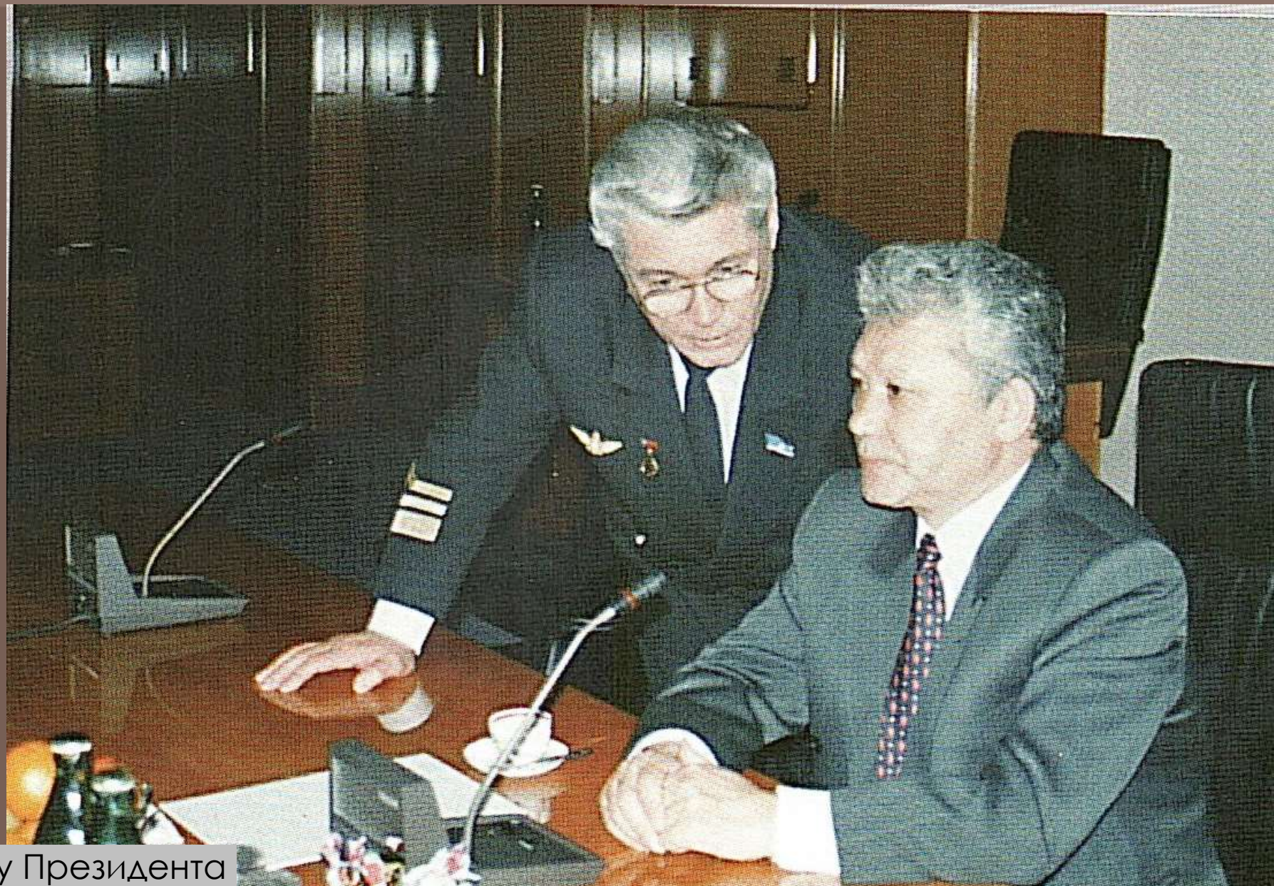
Ю.В.Кайдышев у Президента РС(Я) М.Е.Николаев