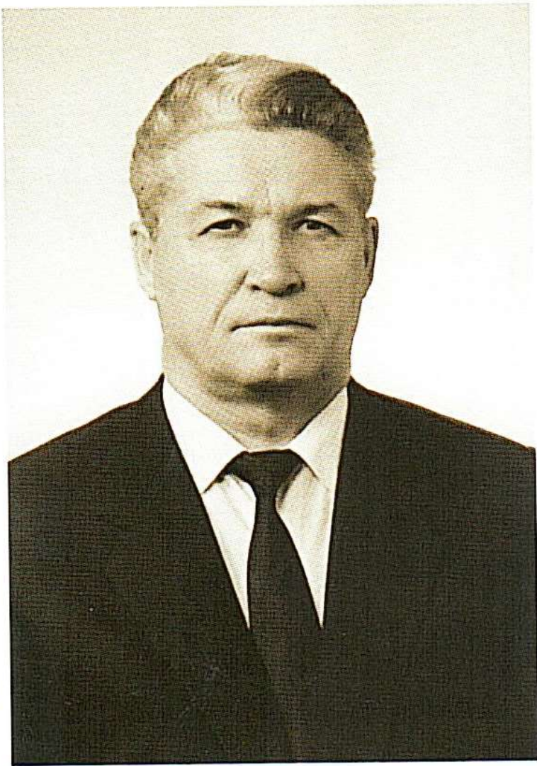
Заместитель Председателя Совета Министров ЯАССР (1979 г.)