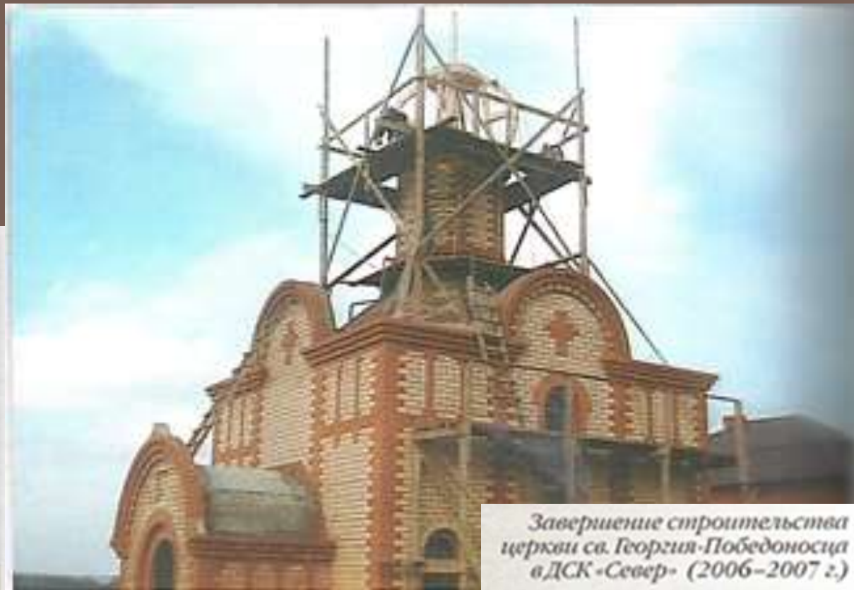
Завершение строительства церкви св. Георгия-Победоносца в ДСК «Север» (2006–2007 г.)