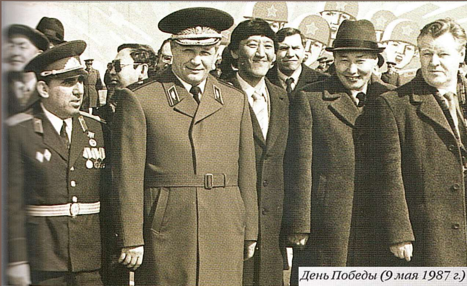
День Победы (9 мая 1987 г.)