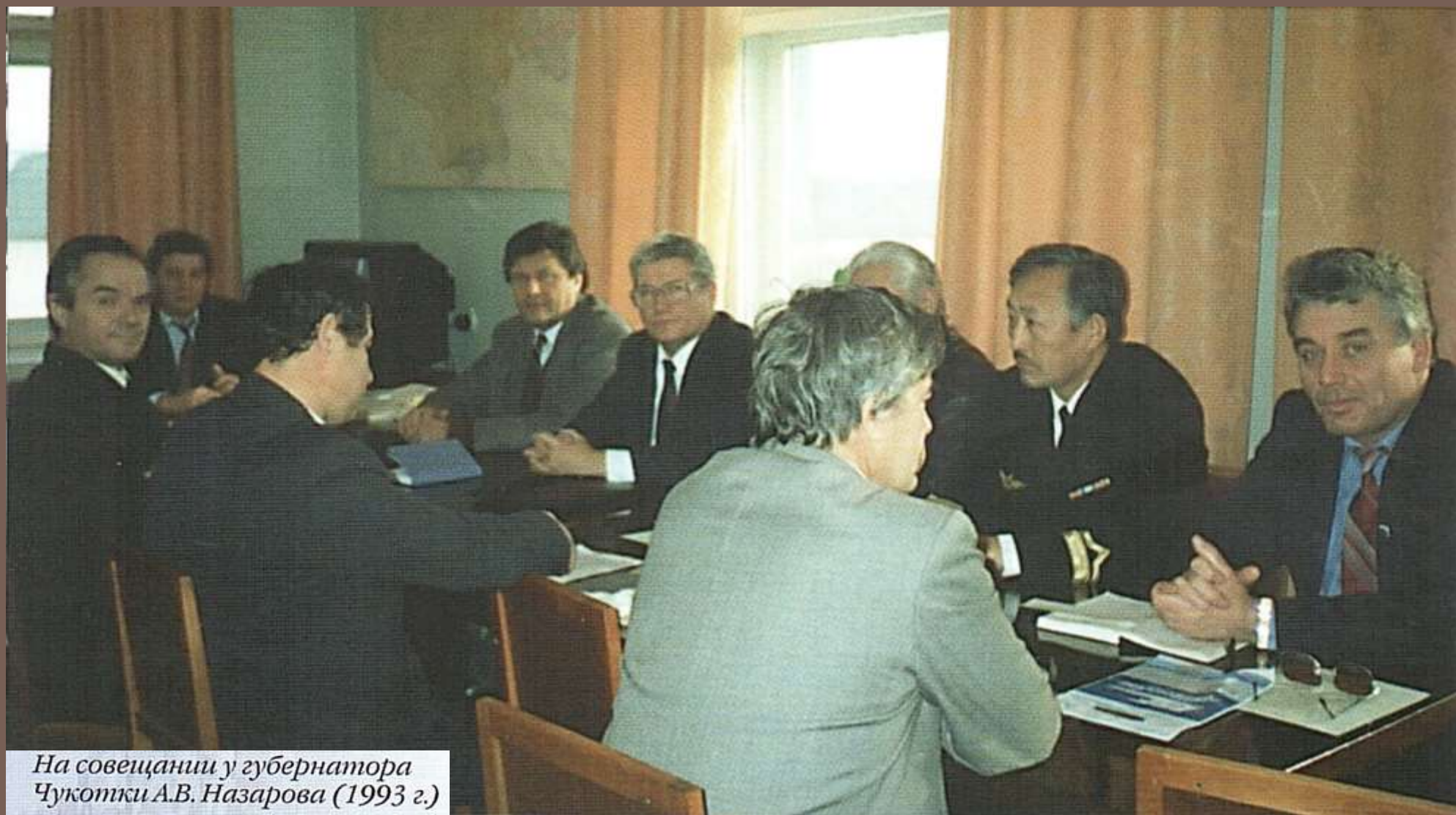
На совещании у губернатора Чукотки А.В. Назарова (1993 г.)