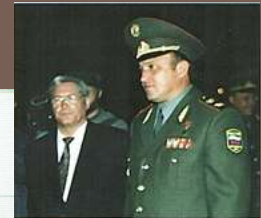
П.С. Грачев в г. Якутске (1995 г.)