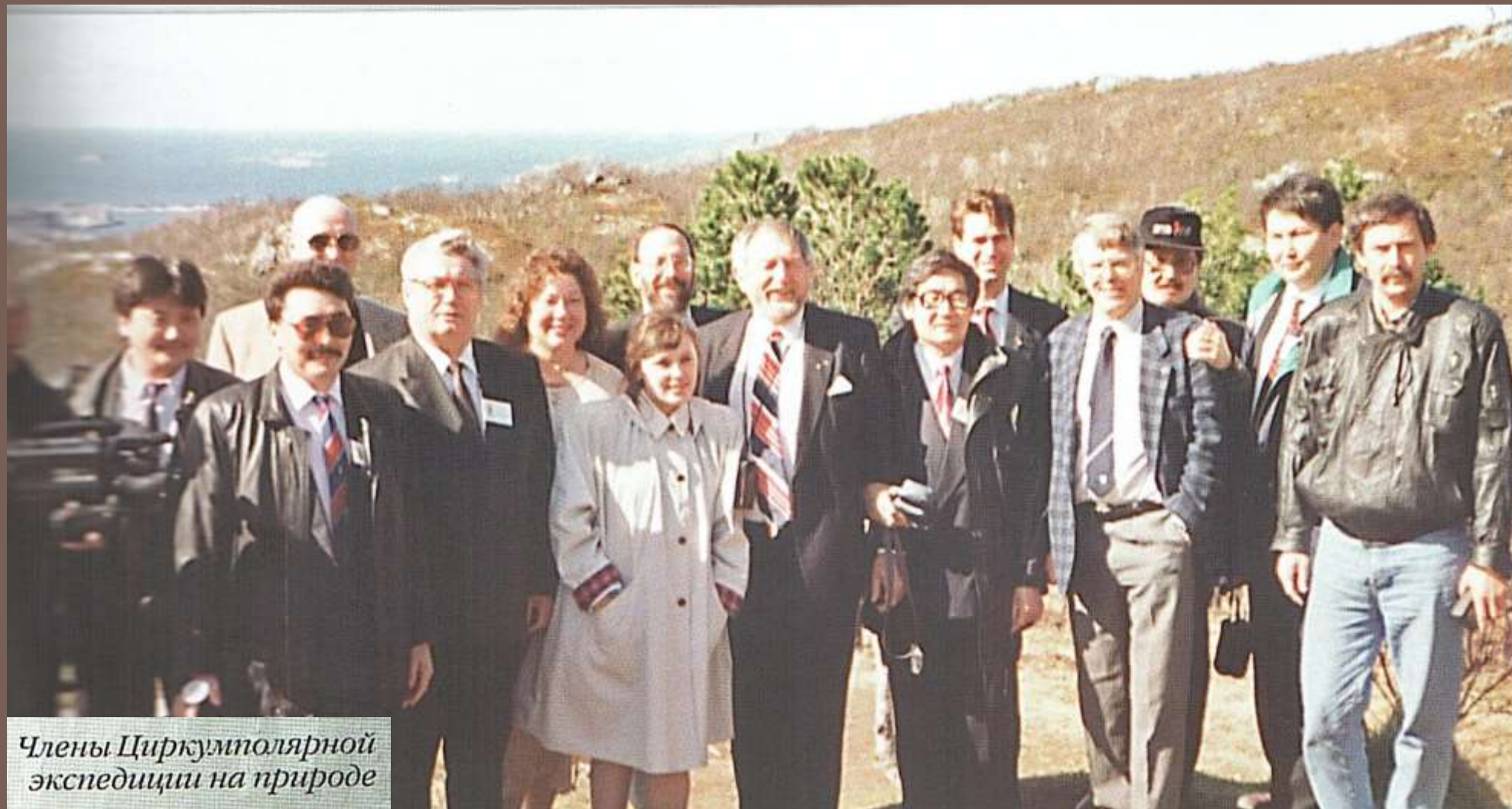
Члены Циркумполярной экспедиции на природе