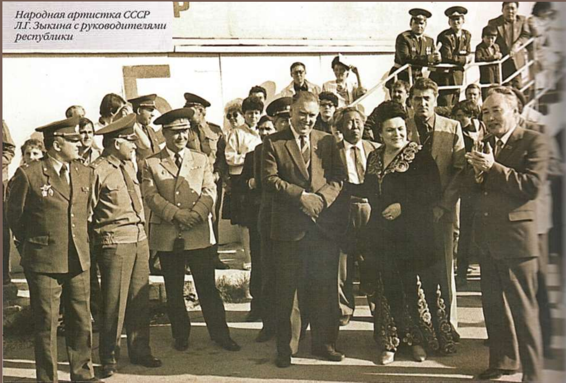
Народная артистка СССР Л.Г. Зыкина с руководителями республики