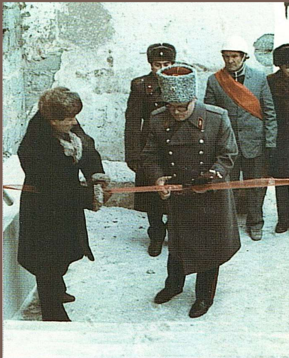
Открытие спортивного комплекса «Динамо» (1987 г.)