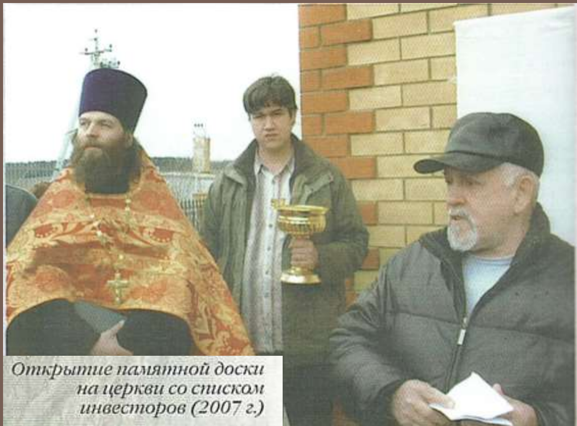
Открытие памятной доски на церкви со списком инвесторов (2007 г.)