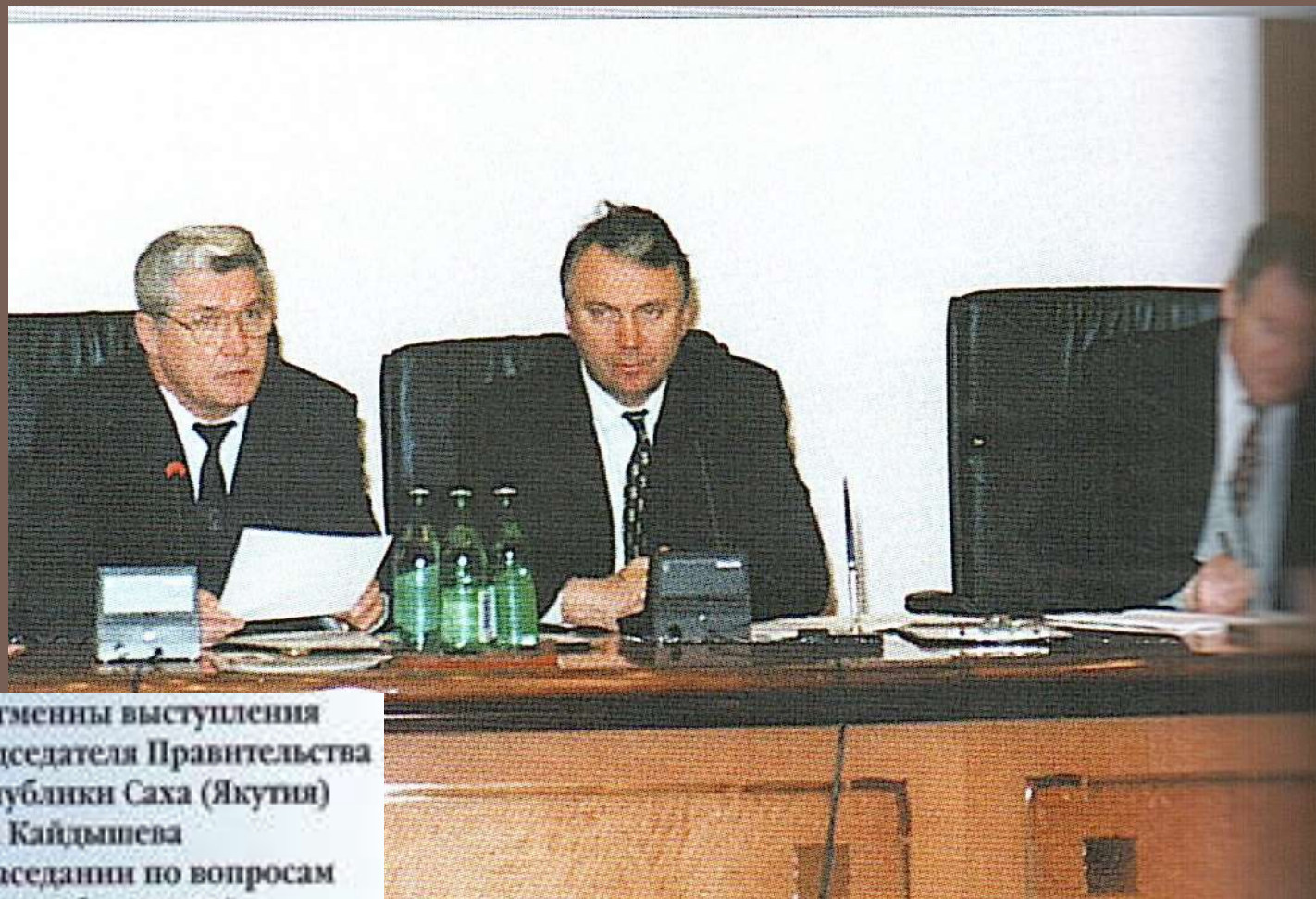
Фрагменты выступления Председателя Правительства Республики Саха (Якутия) Ю.В. Кайдышева на заседании по вопросам золотодобывающей промышленности Якутии