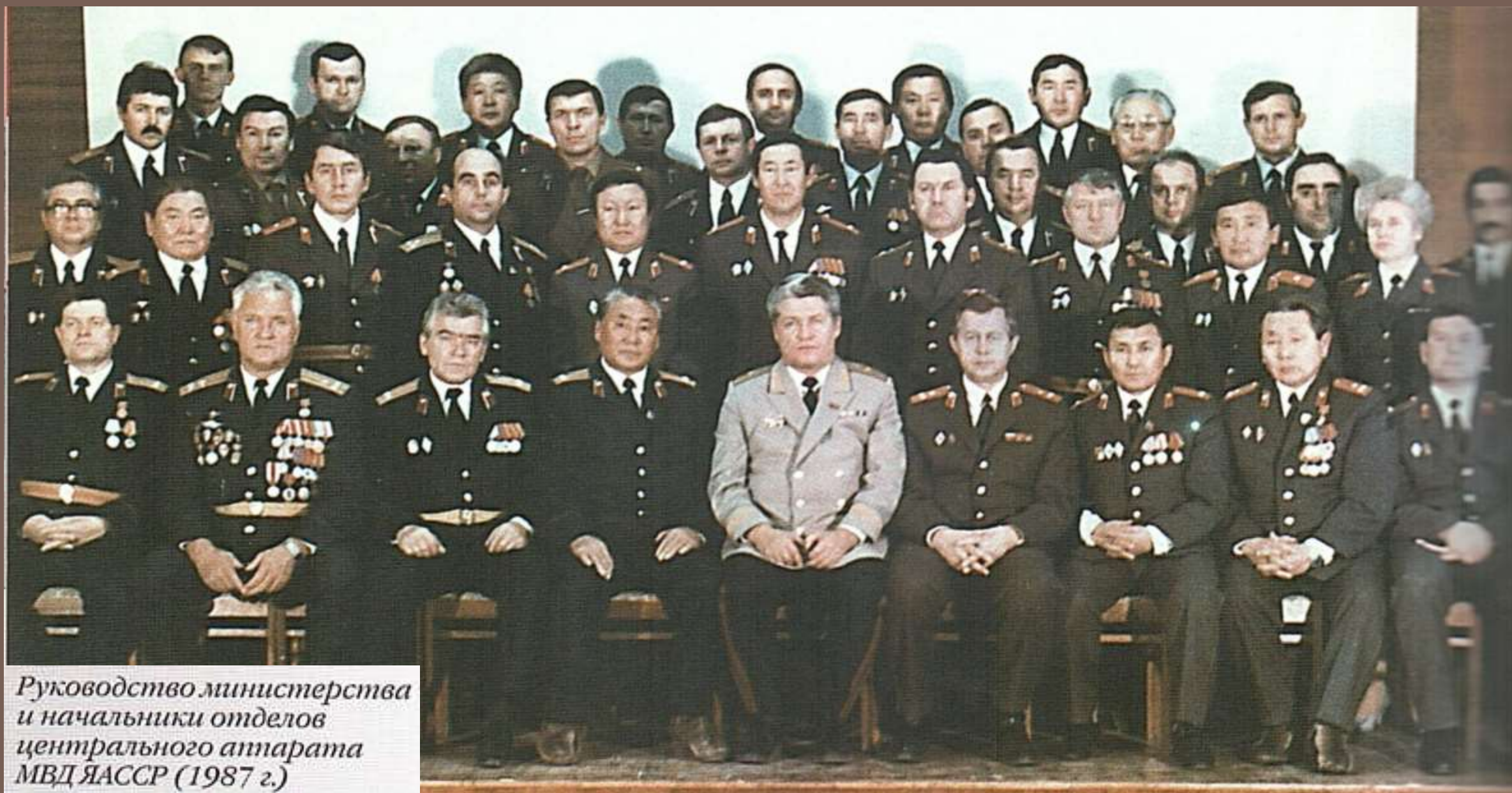
Руководство министерства и начальники отделов центрального аппарата МВД ЯССР (1987 г.)