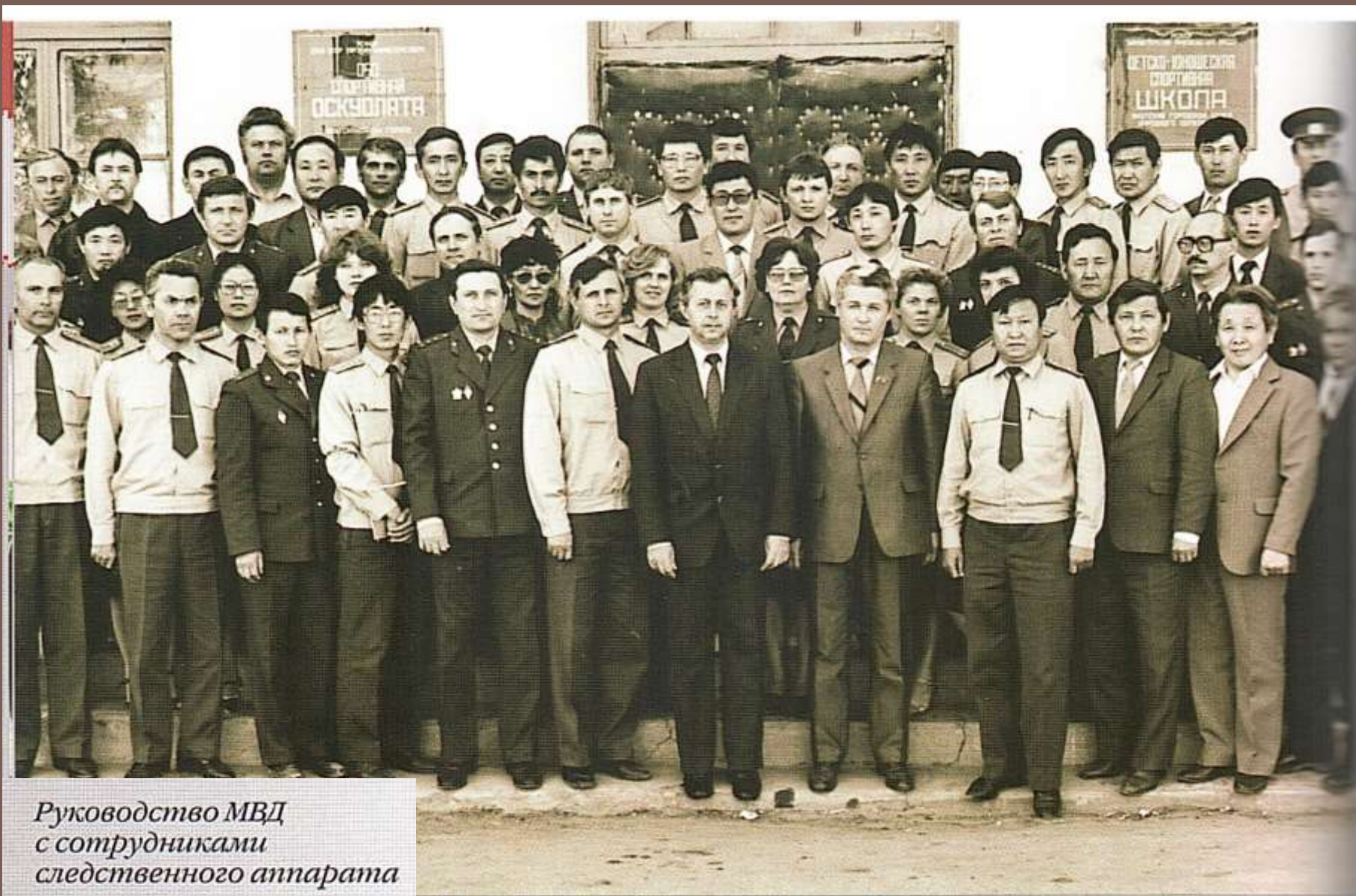
Руководство МВД с сотрудниками следственного аппарата