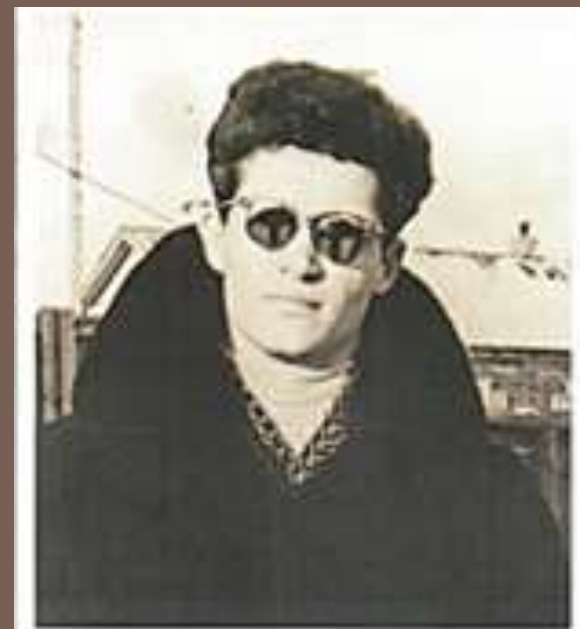
Старший механик теплохода «Ямал» (1962 г.)