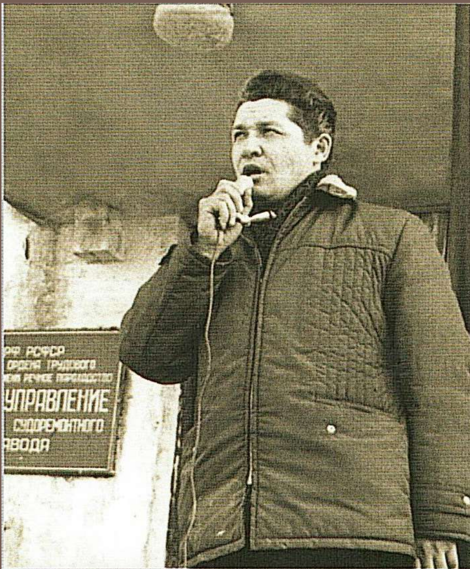
Митинг по поводу апрельского субботника