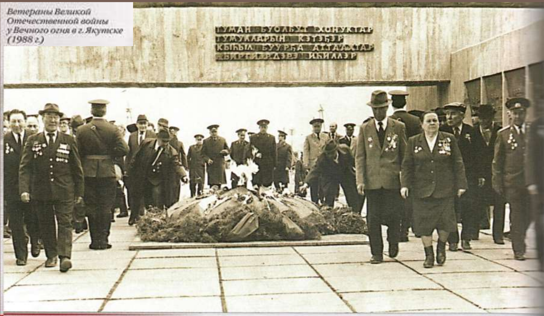
Ветераны Великой Отечественной войны у Вечного огня в г. Якутске (1988 г.)