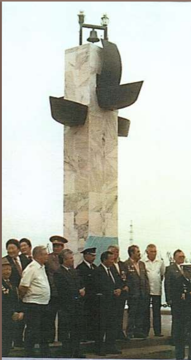
Открытие памятной стеллы, посвященной 100-летию регулярного судоходства на р. Лена, установленной в 202-м квартале г. Якутска (1994 г.)