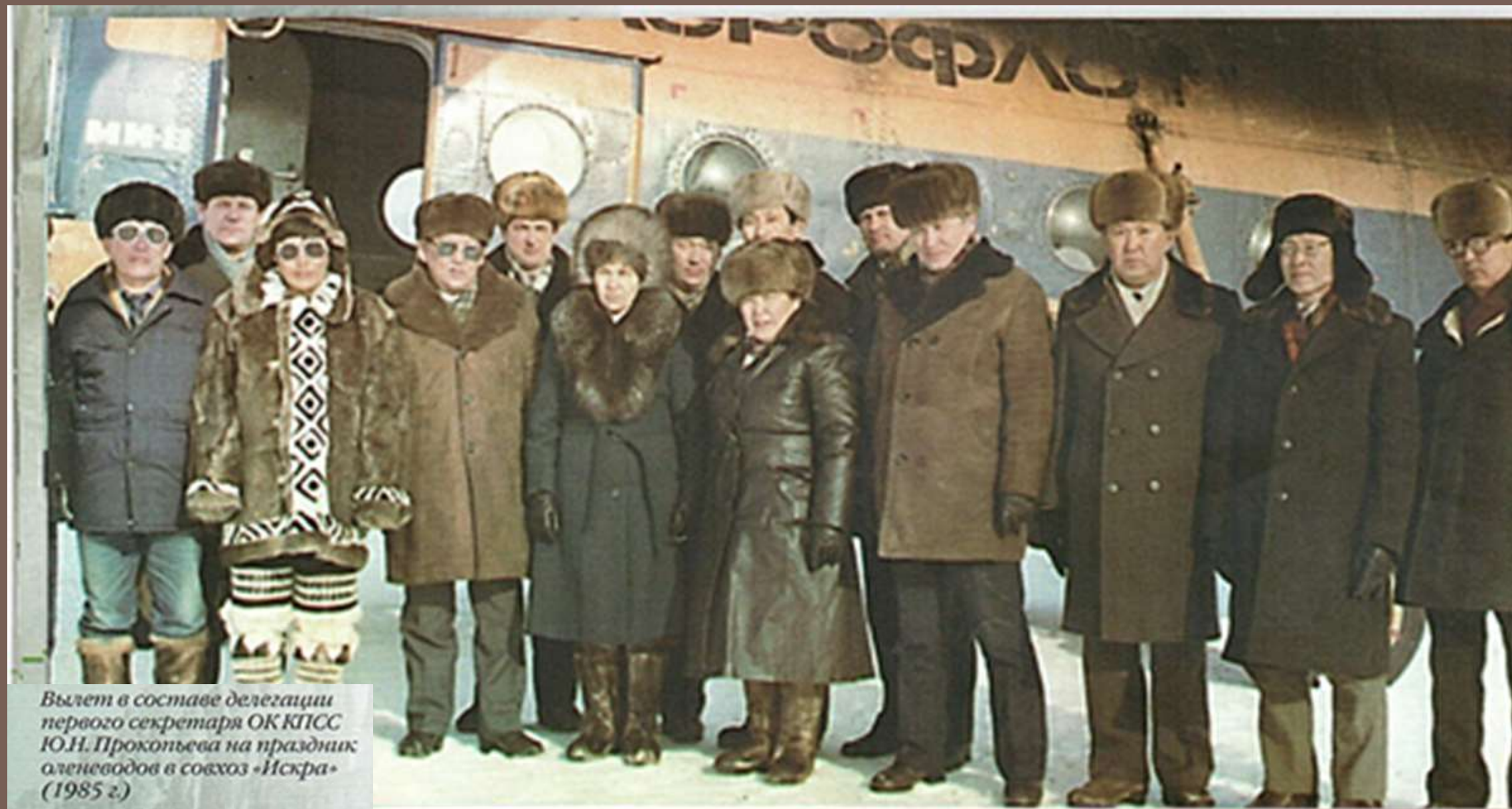
Вылет в составе делегации первого секретаря ОК КПСС Ю.Н. Прокопьева на праздник алюминиеводов в совхоз «Искра» (1985 г.)