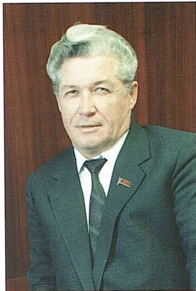
Первый президент акционерной судоходной компания «ОАО «Ленское объединенное речное пароходство» (1993–1994 гг.)