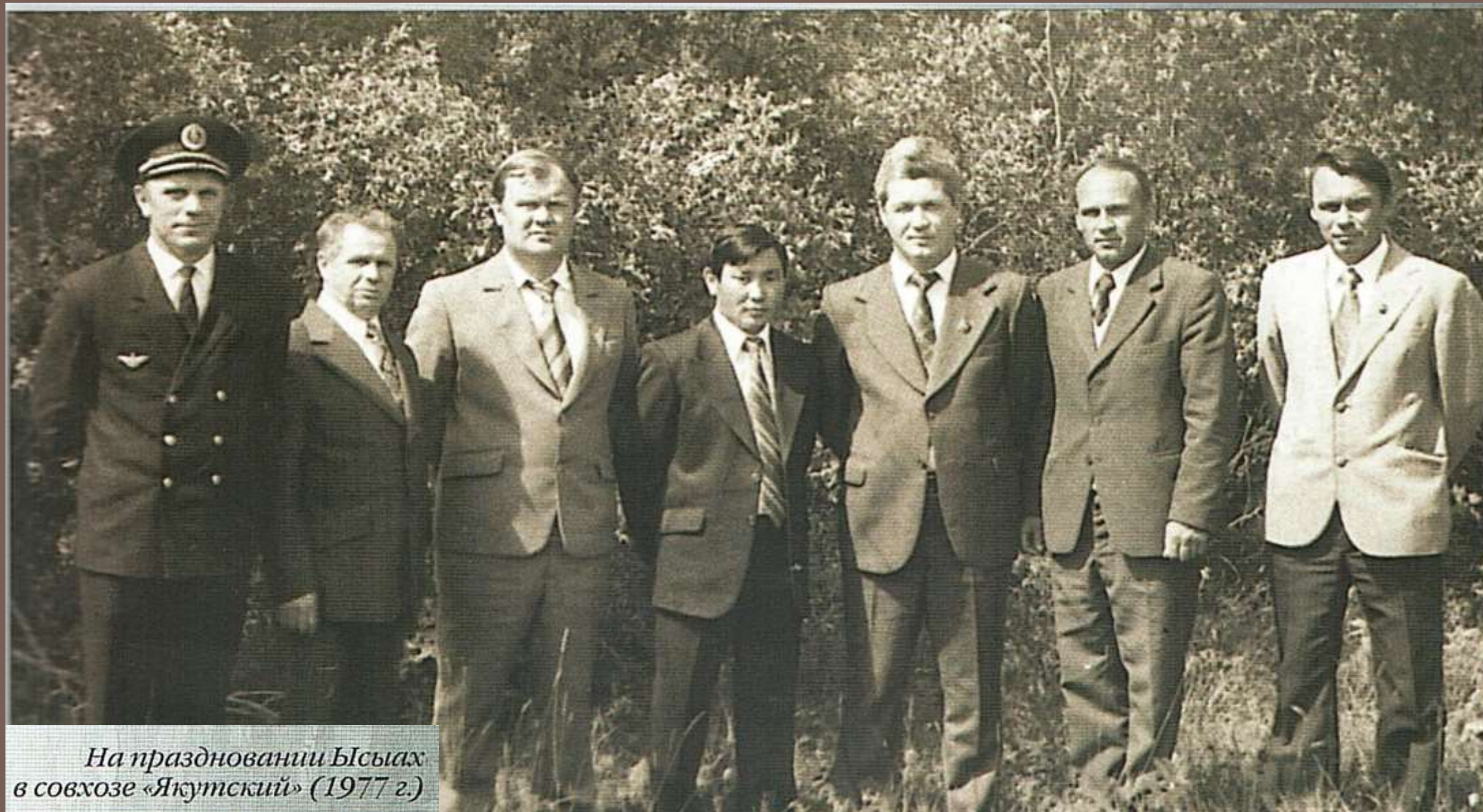
На праздновании Ысыах в совхозе «Якутский» (1977 г.)