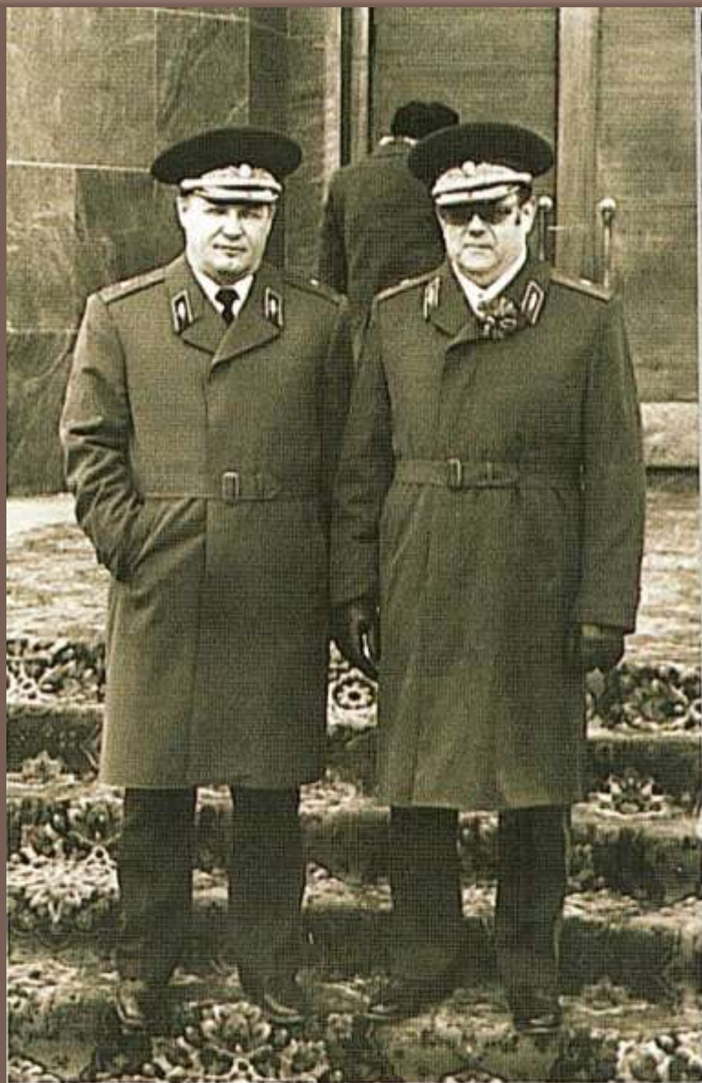
С председателем КГБ ЯАССР Л.А. Выйме на крыльце областного комитета партии