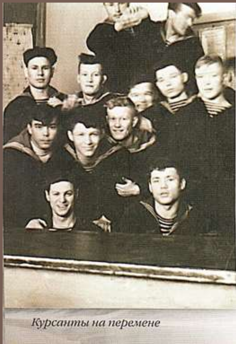
Курсанты на перемене