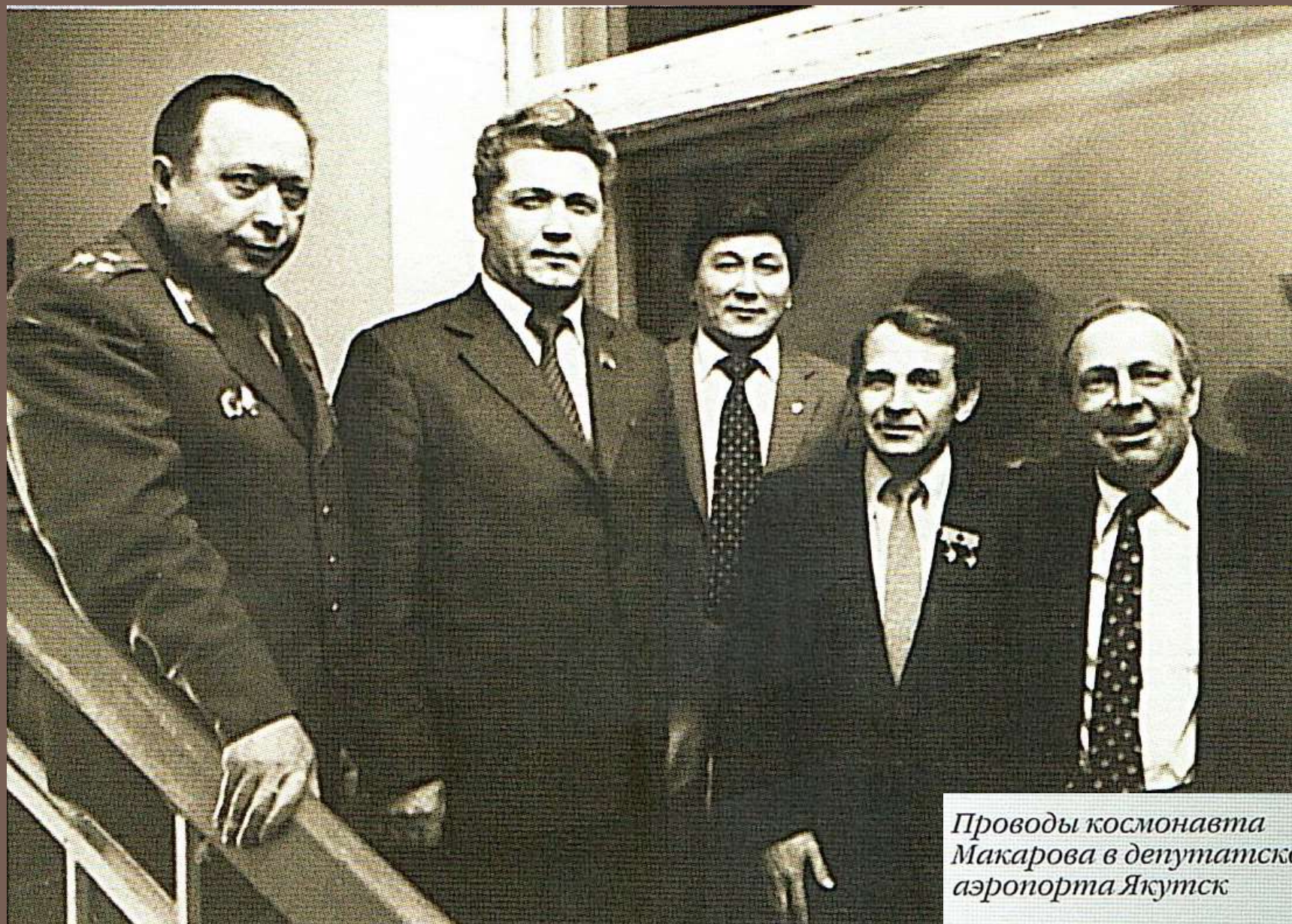
Проводы космонавта Макарова в депутатском зале аэропорта Якутск